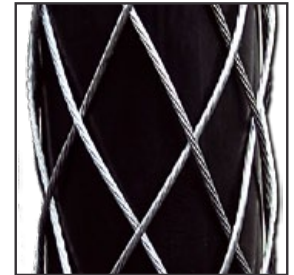
(1-lagig / Standard)