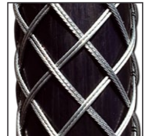
(2-lagig / verstärkt)

RP-600-H: Lieferbar in den Geflechtlängen von 200 mm bis 500 mm Gesamtlänge. Andere Längen auf Anfrage! Selbstverständlich auch lieferbar in den Ausführungen: