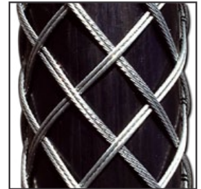
(2-lagig / Standard)