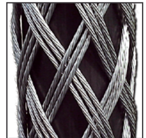
(3-lagig / verstärkt)